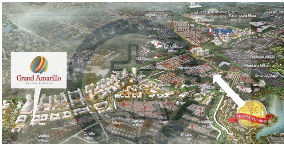
Gambar 1 Lokasi klaster.