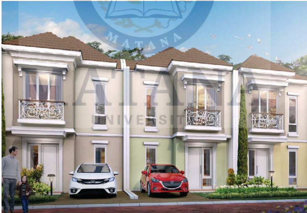
Gambar 3 Tipe rumah Kluster Grand Amarillo.